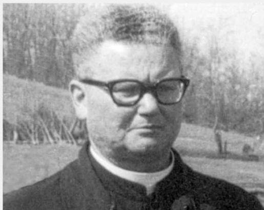
"Fai del bene e buttalo ai pesci" un documentario di Alessandra Fontanesi e Andrea Mainardi (Italia 2017, 37')

Reggio Emilia, Teatro di sant'Agostino, via Reverberi 1 Mercoledì 17 gennaio 2024, ore 20.45